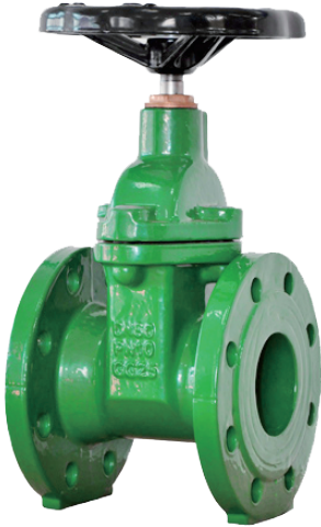
Fig. 3246 (DIN F4) 3247 (DIN F5)